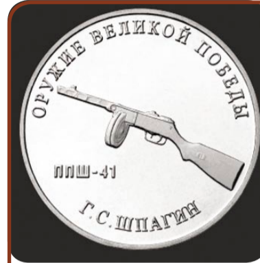
КОНСТРУКТОР ОРУЖИЯ Г.С. ШПАГИН 25 рублей / 2019

Выставка представляет монеты, посвященные конструкторам оружия войны 1941-1945 годов: Георгию Шпагину, создателю пулемета-пулемета образца 1941 года; Михаилу Кошкину, создателю легендарного Т-34; Владимиру Петлякову, конструктору двухмоторного пикирующего бомбардировщика «Пе-2» (знаменитая «пешка»), впервые примененная 22 июня 1941 года.