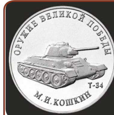
КОНСТРУКТОР ОРУЖИЯ М.И. КОШКИН 25 рублей / 2019

Сдержанность художественного языка и точность деталей – отличительные черты монеты, посвященной конструктору Георгию Шпагину, создателю пулемета-пулемета образца 1941 года. В годы Великой Отечественной войны было выпущено около 6 млн экземпляров этого оружия. Более половины бойцов Красной Армии воевали с пулеметом-пулеметом Шпагина, ласково называя его «папашей».