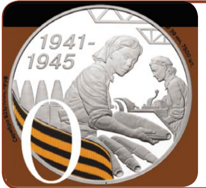
65-я годовщина Победы в Великой Отечественной войне 1941–1945 гг.