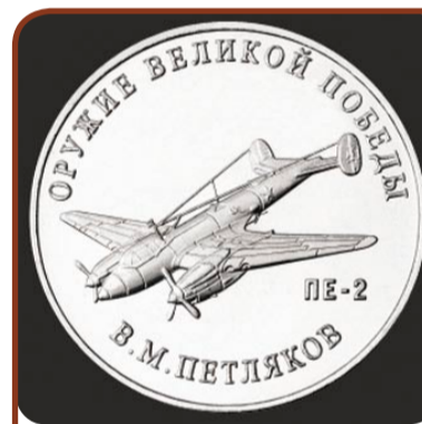
КОНСТРУКТОР ОРУЖИЯ В.М. ПЕТЛЯКОВ 25 рублей / 2019

Легендарный и героический Т-34, созданный советским инженером-конструктором Михаилом Кошкиным, начали производить в 1940 году. Благодаря экономичному дизель-мотору боевая машина получила абсолютное превосходство в проходимости, маневренности и подвижности, значительно повлияв на исход войны.