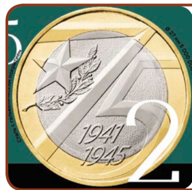
75-летие Победы советского народа в Великой Отечественной войне 1941-1945 гг. 10 рублей / 2019