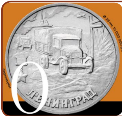
55-я годовщина Победы в Великой Отечественной войне 1941–1945 гг. Ленинград

Всё началось с удивления. В серии «55 годовщина Победы в Великой Отечественной войне 1941-1945г.г. Ленинград» я увидела монету, на ней изображена «полупорка» – да, именно грузовой автомобиль ГАЗ-АА. Я поняла бы, если танк или самолёт, но просто