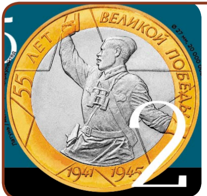
55-я годовщина Победы в Великой Отечественной войне 1941–1945 гг.

А с этой монеты на тебя смотрит женщина. Знакомлюсь с пояснением: «Эта монета посвящена работе женщин в тылу. Сила их духа была настолько велика, что они, не задумываясь, справлялись с огромной физической нагрузкой. В этот тяжелейший период на заводах страны, где, по разным оценкам, более двух третей штата составляли женщины, было произведено около 870 000 единиц боевой техники.»