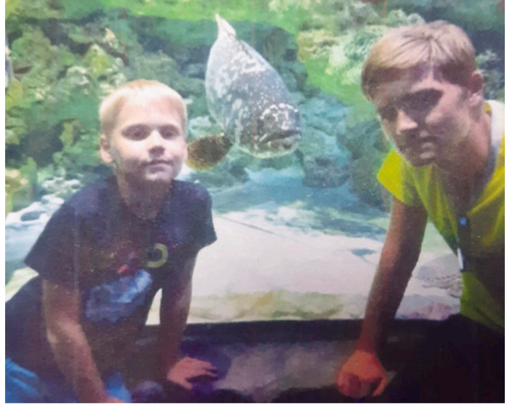
Хорошо, когда есть старший брат!

Роль детей в семье все оценивают одинаково. Бабушка: «Дети укрепляют семью». Папа: «Дети создают в семье хороший климат». Мама подвела итог: «У нас в семье всё прекрасно: как хотелось, так и есть».